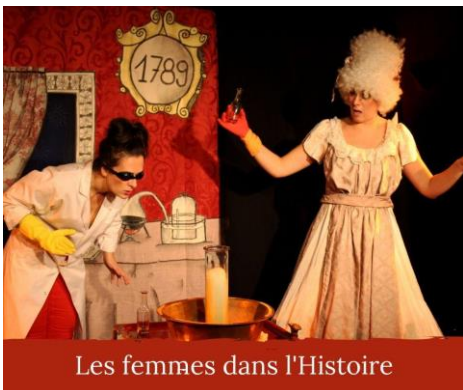
Les femmes dans l'Histoire