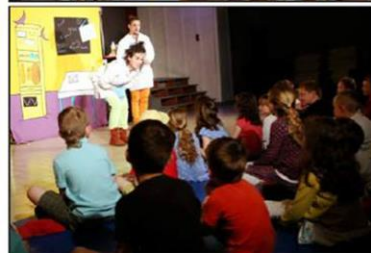
La Cie Colegram a présenté son spectacle scientifique et interactif "Panique chez les Mynus".