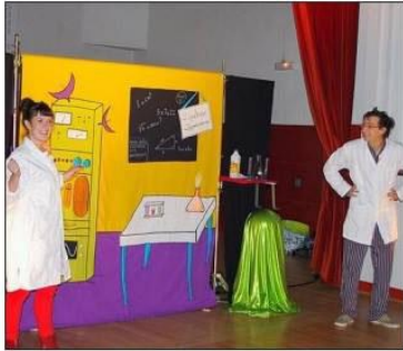
Les acteurs étaient vraiment excellents, faisant beaucoup rire les enfants et les adultes.