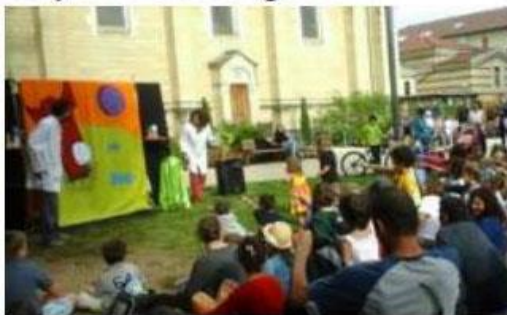
■ Tout l'Monde Dehors était en visite à Montchat.

Il y avait du monde ce samedi après-midi, sur la pelouse du jardin de l'église. L'une des nombreuses animations, prévues dans le cadre de l'opération Tout l'monde dehors, faisait halte à Montchat. L'une des seules animations prévues dans le quartier durant l'été. Ainsi, les