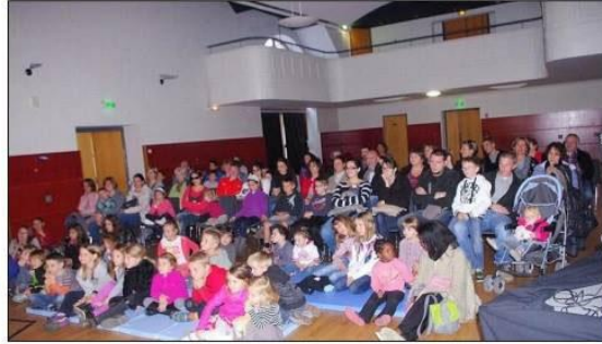
Les acteurs étaient vraiment excellents, faisant beaucoup rire les enfants et les adultes.

Organisé par les médiathèques intercommunales Bourbre-Tisserands, un spectacle était proposé aux enfants, samedi, à 18 h à la salle des fêtes des Abrets. Plus de 80 personnes étaient présentes pour suivre ce spectacle haut en couleurs, riche en gag et drôleries. "Panique chez les Mynus" a séduit com-