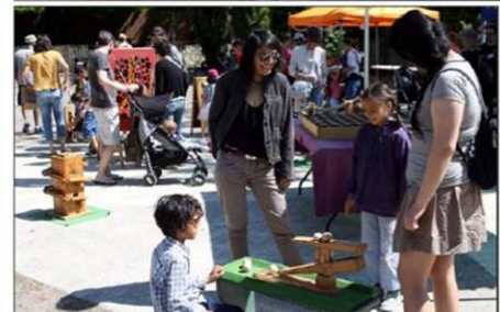
Jeux, activités manuelles, de bricolage, spectacles, animations diverses et une dizaine d'ateliers étaient proposés hier, toute la journée, à l'occasion du festival Môme Z'émerveille. Cette manifestation est dédiée aux enfants et à leurs familles.